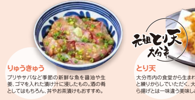
りゅうきゅう ブリやサバなど季節の新鮮な魚を醤油や生姜、ゴマを入れた濁り汁に漬したも、酒の肴としてはもちろん、丼やお茶漬けもおすすめです。 とり天 大分市内の食堂から生まれた鶏の天ぷら。群醤油と練りからしを添えていただく。大分では定番の一品。から揚げとは一味違う美味しさです。 おおいの味を堪能できるお店はこちら