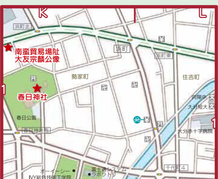
南蛮貿易場跡 大友宗麟公像 春日神社 春日公園