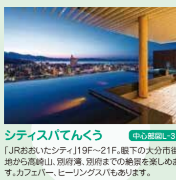
シティスパてんくう 中心部回L-3 JRおおいたシティ19F~21F。眼下の大分市街地から高崎山、別府湾、別府までの絶景を楽しめます。カフェバー、ヒーリングスパもあります。