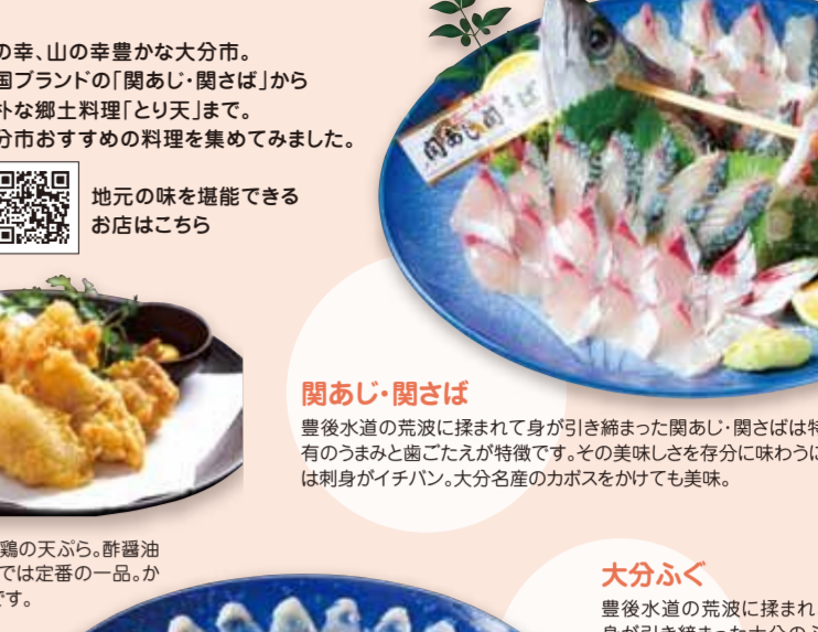
おおいの味を堪能できるお店はこちら おおいの味を堪能できるお店はこちら