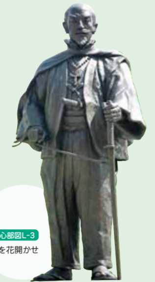
大友宗麟公像 中心部回L-3 豊後府内に南蛮文化を花開かせた戦国大名。