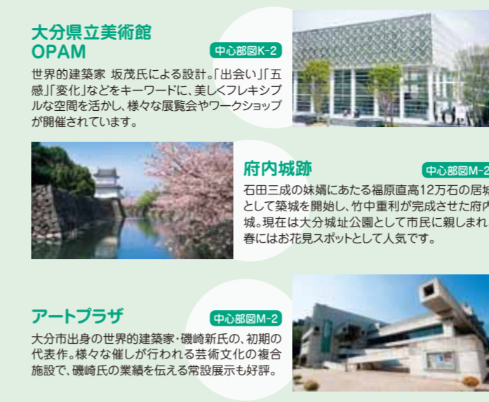
大分県立美術館 OPAM 中心部回K-2 世界的建築家 坂茂氏による設計。「出会い」「五感」「変化」などをキーワードに、美しくフレキシブルな空間を活かし、様々な展覧会やワークショップが開催されています。 府内城跡 中心部回M-2 石田三成の妹婿にあたる福原直高12万石の居城として築城を開始し、竹中重利が完成させた府内城。現在は大分城址公園として市民に親しまれ、春にはお花見スポットとして人気です。 アートプラザ 中心部回M-2 大分市出身の世界的建築家・磯崎新氏の、初期の代表作。様々な催しが行われる芸術文化の複合施設で、磯崎氏の業績を伝える常設展示も好評。