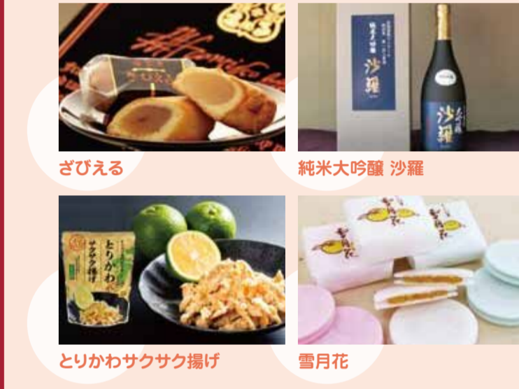
お土産 土産 どびえる 純米大吟醸 沙羅 とりかわサクサク揚げ 雪月花